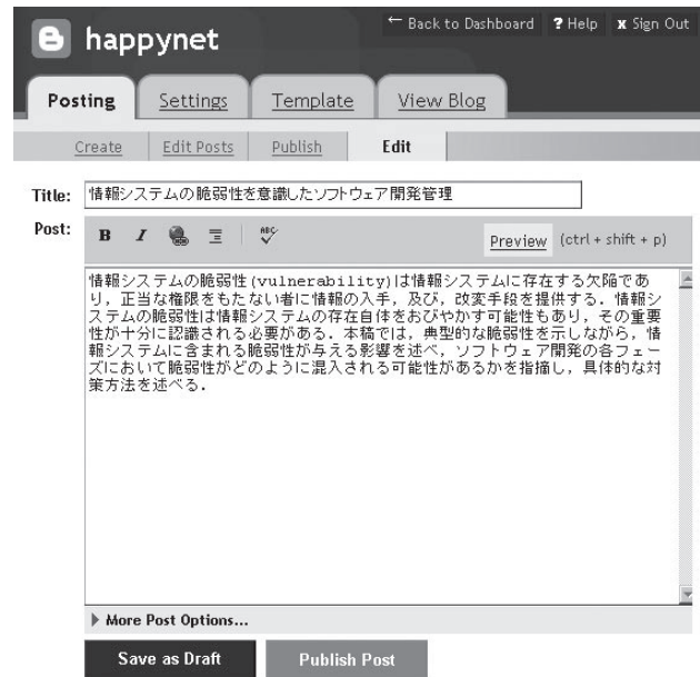
図-2 エントリーの編集

成された4つのエントリーの一覧が表示されている。ま た、エントリーを削除できる。