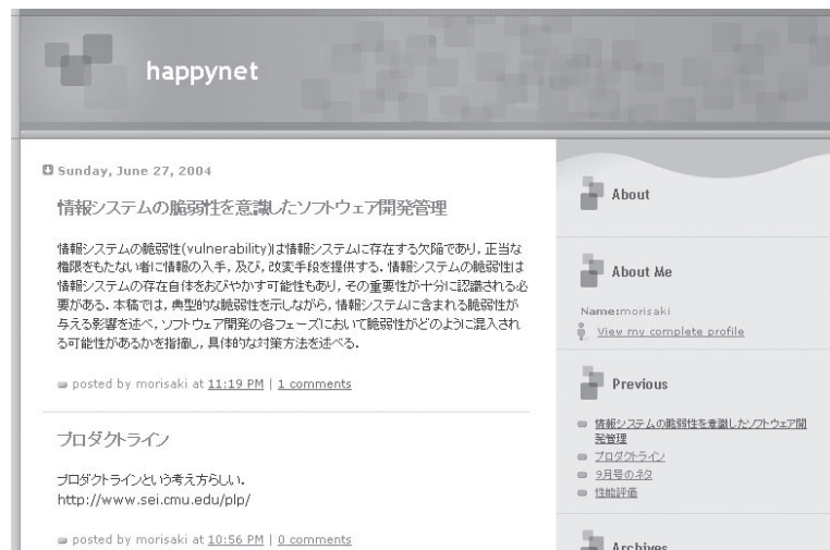
図-3 生成されたページ